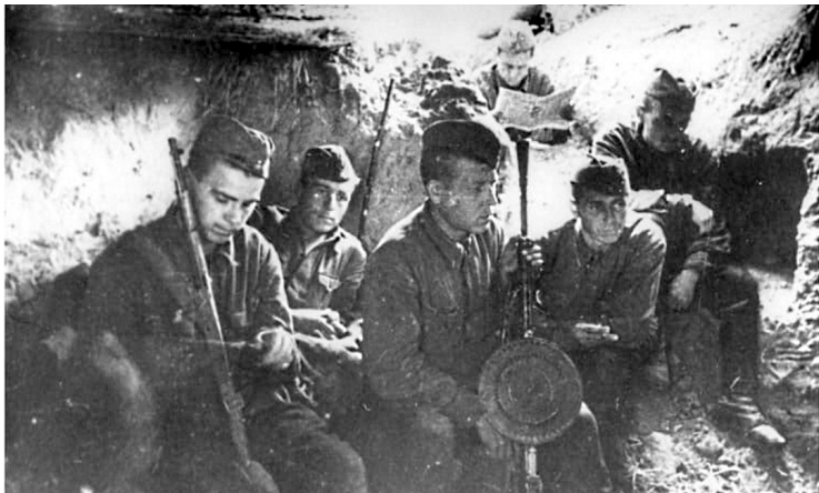
Бойцы дивизии народного ополчения на Лужском рубеже, август 1941 г.

Бои были жестокими. Враг рвался к Ленинграду. Силами обороны на Луге он был остановлен почти на 5 месяцев, потеряв много войск и оружия.