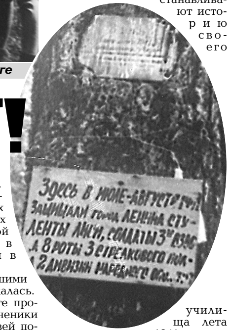
училища лета 1941 года

Актив музея проводил по классам беседы и уроки мужества. Мы не забывали о данном нами обещании - помнить! Но в 90-е годы до нас дошла весть о том, что сосны-памятника у деревни Лычно уже нет. Ее спилили, а куда делись дощечки, никто не знает. Походы прекратились. Мы забыли о нашей клятве помнить? На душе было тревожно. Но счастливый случай свел меня с поисковым отрядом бывших курсантов Кировского училища. Они восстанавливают историю своего