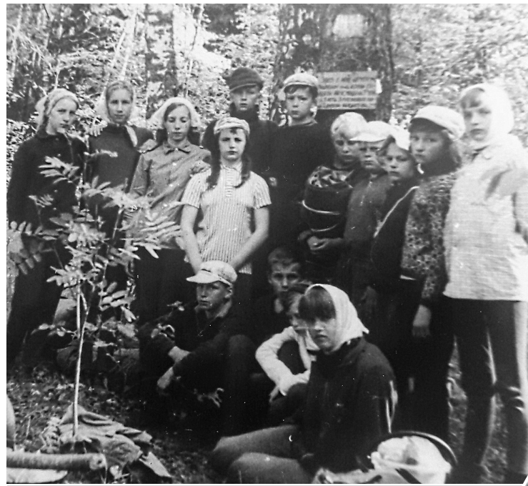
Школьники ВСШ №1 в походе по местам боев на Луге

Первая наша встреча с войной произошла в деревне Большой Сабск на крутом